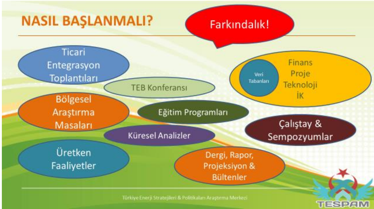
Şekil 1: Türk Dünyası Enerji Birliği Başlangıç Modeli (TESPAM, 2019)

Bu bağlamda Türk dünyası enerji birliği oluşturmak gayeli, aşağıdaki grafik incelendiğinde,