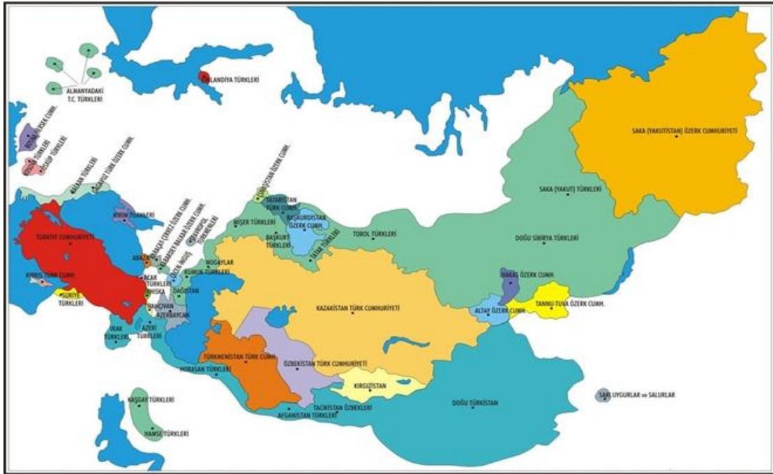
Harita 1: Türk Coğrafyası ( http://aygunhoca.com/cograf-haritalar/72-turkiye-haritalari/3469-turk-dunyasi-haritasi-buyuk-boyutlu.html )

Bu bağlamda Türk dünyası aşağıdaki harita üzerinden incelendiğinde,