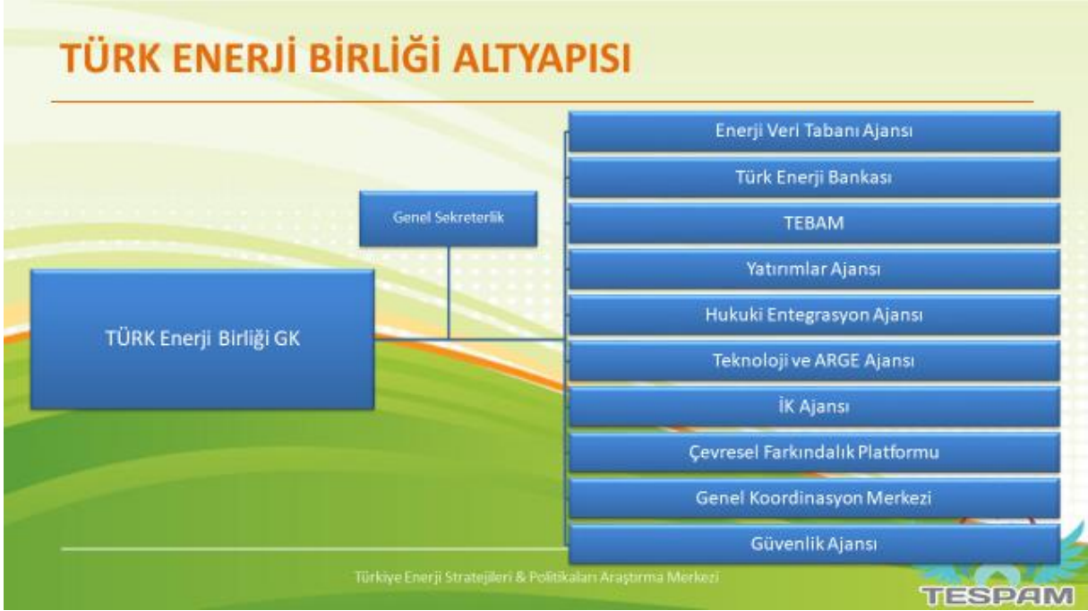
Şekil 2: Türk Dünyası Enerji Birliği Yapılanması (TESPAM, 2019)

Bir sonraki adımda ortak karar alınması durumunda TEB aşağıdaki grafikten de görülebileceği bir modelde, yine ilgili ülkelerin devlet başkanlarınca temsil edilen yeni bir modele kavuşturulabilecektir.